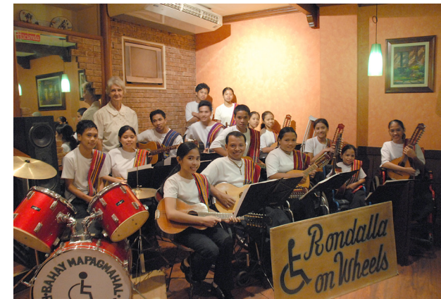
Optreden in een restaurant in Manila voor Belgische bezoekers

Na hun verblijf in het "Liefdevol Tehuis" mochten de afgestudeerde muzikanten lid blijven van de muziekgroep "Rondalla on Wheels". Ze moesten zich dan wel engageren om regelmatig deel te nemen aan de repetities. Ze kregen dan ook de naam "senioren", terwijl de kinderen in het tehuis de "juniores" werden genoemd. Beide groepen hebben vele jaren samen geoefend en opgetreden.