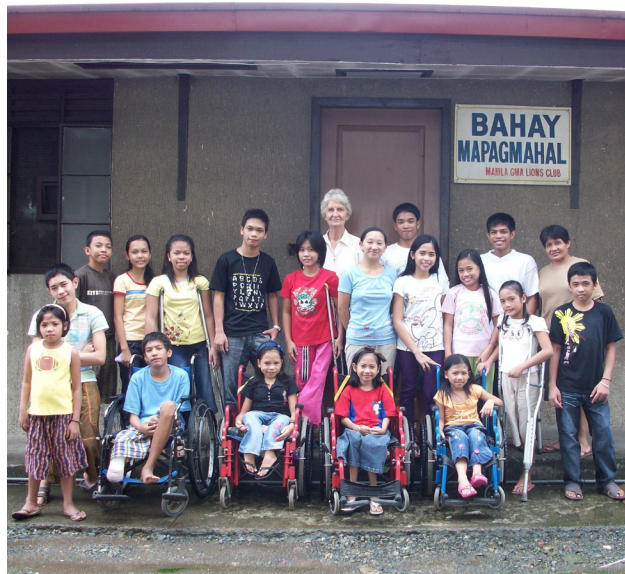
Kinderen van Bahay Mapagmahal (Liefdevol Tehuis)

Maar mijn liefde ging ook uit naar een twintigtal kinderen die verbleven in het "Liefdevol Tehuis", of "Bahay Mapagmahal" in het Tagalog. Ik was hun opvoedster en begeleidster. "Liefdevol Tehuis" is een privé-initiatief, dat een tijdelijk woonverblijf aanbiedt voor opgroeiende en schoolgaande kinderen en jongeren met een fysieke beperking. Het Tehuis is gelegen in het domein van het Filipijns orthopedisch centrum in Manila. De jongeren komen uit alle delen van het land, uit zeer arme families, of uit de sloppenwijken, waar er geen mogelijkheid bestaat om naar school te gaan.